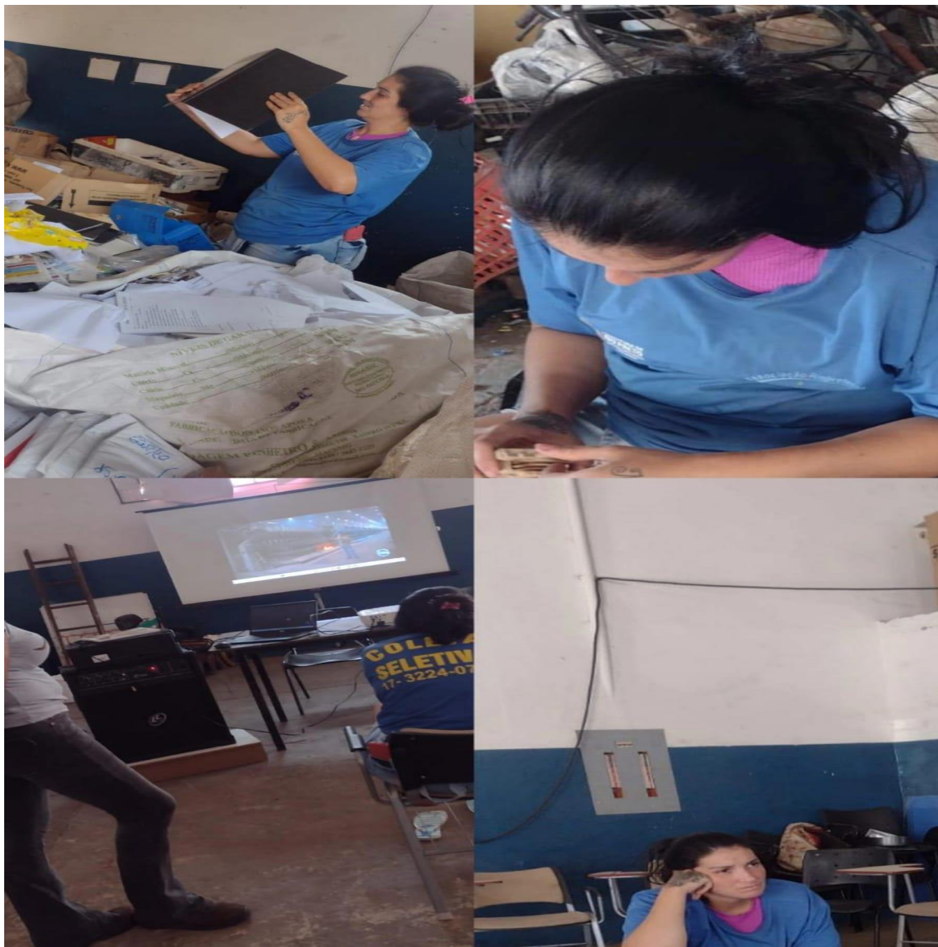
29/09/2023 11 – EVENTOS

Rua Iiritiba, 1370 – Jd. Sônia – CEP. 15050-462 – São José do Rio Preto – SP Fone/Fax: (17) 3224-0733 – e-mail: aresriopreto@gmail.com – CNPJ: 51.858.561/0001-67 Utilidade Publica Lei: 7119/98 Utilidade Publica Estadual – 15272/2013.